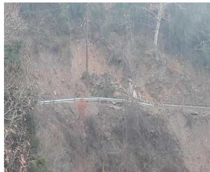
Η οδός προς το ξενοδοχείο

Σύμφωνα με πληροφορίες από την ιστοσελίδα Lakonia Live, το πρωί της ίδιας ημέρας, αυτοκίνητο όχημα που κινείτο στην περιοχή, παρασύρθηκε από το ποτάμι της Παναγίας.