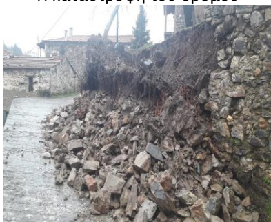
Η γκρεμισμένη πεζούλα