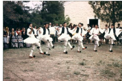
Στον Άγιο Κωνσταντίνο

Ακολούθησε η υλοποίηση της ιδέας του «Α.Σ. Ο Καρυάτης» το καλοκαίρι του 1992 για την δημιουργία χορευτικού τμήματος. Πρωτοστάτησαν μερικά άτομα που είχαν κοινό χαρακτηριστικό την αγάπη για τη γνήσια παράδοση, την γνήσια λαογραφία, για τα ήθη και τα έθιμα και τον ελληνικό παραδοσιακό χορό.