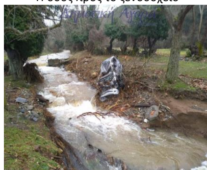
Το κατεστραμμένο όχημα

Τελευταία στιγμή ο οδηγός βγήκε από το όχημα και πιάστηκε στα κιγκλιδώματα της γέφυρας, ενώ στη συνέχεια κάτοικοι του χωριού πήγαν με αγροτικό μηχάνημα και τον απομάκρυναν από το σημείο. Το αυτοκίνητο παρασύρθηκε από τα ορμητικά νερά για ένα χιλιόμετρο και καταστράφηκε ολοσχερώς.