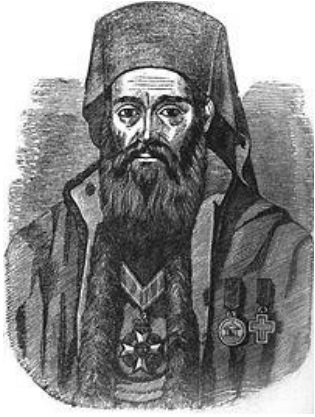
ο Θεοδώρητος ο Β'

Οι Αραχωβίτες/Καρυάτες έλαβαν μέρος σε όλες σχεδόν τις μάχες που έγιναν στην Πελοπόννησο κατά τα έτη 1821-26, αλλά και στις μάχες των Αθηνών τα έτη 1821-26. Επειδή από την Αράχωβα δεν φάνηκε από την αρχή της Επανάστασης κάποιος μεγάλος οπλαρχηγός οι Καρυάτες είχαν καταταχθεί σε διάφορα σώματα Λακεδαιμόνιων κυρίως οπλαρχηγών. Ωστόσο, το 1821 ο Αναγνώστης Δ. Ματάλας έκανε ένα μικρό σώμα από Αραχωβίτες και το 1826 ο Παρασκευάς Δ. Ματάλας αναγνωρίστηκε ως οπλαρχηγός. Λόγω και του παραπάνω γεγονός οι περισσότεροι Αραχωβίτες κατατάχθηκαν στο σώμα του μεγάλου οπλαρχηγού Πέτρου Μπαρμπιτσιώτη υπό την καθοδήγηση του ηρωικού Δεσπότη Βρεσθένης Θεοδώρητου Β' . Εδώ αξίζει να αναφερθούμε στις δύο αυτές ηρωικές μορφές του λακωνικού Πάρνωνα.