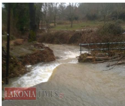
Η καταστροφή του δρόμου

Παράλληλα και σε άλλα σημεία του χωριού έγιναν κατολισθήσεις κυρίως από πεζούλες που γκρεμίστηκαν, ενώ ο και ο δρόμος προς το Ξενοδοχείο το « ΑΡΧΟΝΤΙΚΟ ΤΟΥ ΠΑΡΝΩΝΑ » έκλεισε και χρειάστηκαν να έρθουν μηχανήματα της Νομαρχίας για την διάνοιξή του.