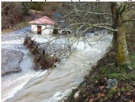
Τα νερά πάνω από την γέφυρα

Πρωτοφανείς ήταν οι καταστροφές που προκλήθηκαν από την κακοκαιρία στις Καρυές την Τετάρτη 6 Φεβρουαρίου . Μετά από πολλές μέρες συνεχόμενης έντονης βροχής το έδαφος δεν άντεξε να απορροφήσει άλλο νερό και έγιναν κατολισθήσεις σε διάφορα σημεία του χωριού.