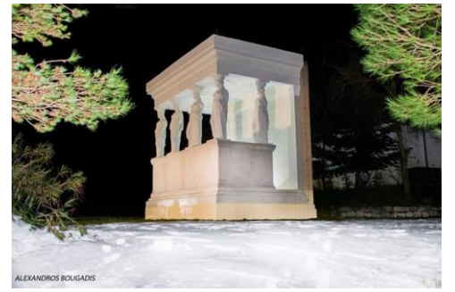
Οι χιονισμένες Καρυάτιδες

Ενημερωτικό Δελτίο του Συνδέσμου των Απανταχού Καρυατών