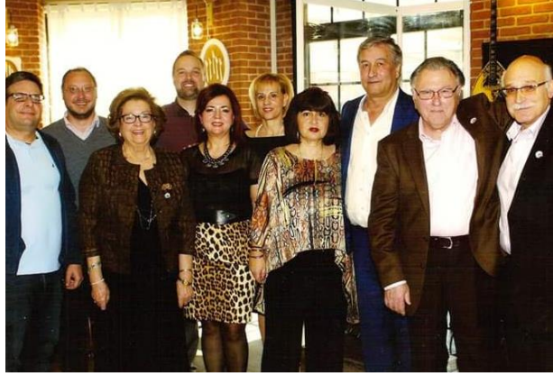
Τα μέλη του Δ.Σ.

Με μεγάλη επιτυχία διοργανώθηκε για άλλη μια χρονιά ο ετήσιος χορός του Συνδέσμου των Απανταχού Καρυατών. Οι συμπατριώτες μαζεύτηκαν την Κυριακή στις 10 Φεβρουαρίου στο κέντρο «Ο ΚΑΠΕΤΑΝΙΟΣ» στα Πετράλωνα για να ανταμώσουν και να διασκεδάσουν.