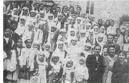
Καρυές: 25 η Μαρτίου 1947

Επιστρέφοντας πάλι στην Τρίπολη σχεδιάζει να επιτεθεί στην Μάνη από τα ανατολικά. Για τον σκοπό αυτό προχωρεί προς το Άστρος όπου βρίσκει αντίσταση από τον Νικητάρη και από εκεί τον Ιούλιο χωρίζει τον στρατό του σε τρία μέρη προκειμένου μέσω του Πάρνωνα να φτάσει στον Μυστρά . Το ένα τμήμα προχωρεί προς την Τσακωνιά καταστρέφοντας τον Πραστό , το άλλο κινείται μέσω Βαμβακού και το τρίτο με επικεφαλής τον ίδιο τον Ιμπραήμ μέσω Αγίου Πέτρου και Αράχωβας (την οποία και αντικρύζει κατεστραμμένη) φτάνει στην κοιλάδα του Ευρώτα. Όπου βρίσκουν Έλληνες τους σκοτώνουν. Δύο Αραχωβίτες σκοτώθηκαν στην Νεραϊδόβρυση και άλλοι είκοσι στην θέση Κακονέρι, ενώ πολλούς άλλους κυρίως γυναίκοπαιδα τα αιχμαλωτίζουν για πούλημα στα σκαλοβοπάζαρα της Ανατολής. Ευτυχώς το επόμενο διάστημα αρκετοί συγγενείς κατάφεραν να εξαγοράσουν πολλούς αιχμαλώτους που είχαν μεταφερθεί στην Πύλο πληρώνοντας λύτρα.