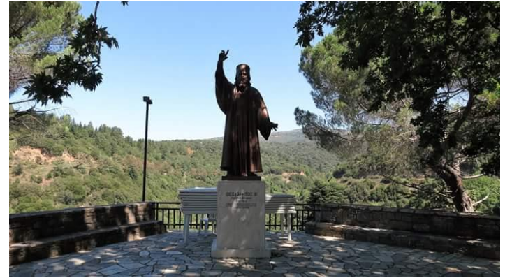
Το άγαλμα του ιεράρχη στην πλατεία της Βαμβακού

Το 1819 μυείται στην Φιλική Εταιρεία από τον επίσκοπο Παλαιού Πατρών Γερμανό και αμέσως η ανάσταση του Γένους γίνεται ο πρωταρχικός τους σκοπός. Πράγματι, με την εκδήλωση της Επανάστασης σπεύδει στο Μυστρά , όπου και ευλογεί στις 28 Μαρτίου την επαναστατική σημαία και αρχίζει άμεσα την στρατολόγηση στην Βαμβακού , στην Βαρβίτσα και τις Καρυές .