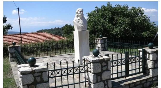
Το άγαλμα του οπλαρχηγού στην είσοδο της Βαρβίτσας

Ο Κολοκοτρώνης τον ξεχωρίζει αμέσως και του λέει « Αναγνώστη των παιδιά είναι πολλά και συ πρέπει να ξεχωρίζεις από όλους. Γιατί δεν παίρνεις το όνομα της πατρίδας του της ξακουστής Μπαρμπίτσας; » Από τότε του έμεινε το όνομα Μπαρμπιτσιώτης . Στην συνέχεια συμμετέχει στην υπεράσπιση του κάστρου του Άργους από τον Δράμαλη και μάλιστα ως επικεφαλής, καθώς και τόσο εναντίον του Κιουταχή με τον Καραϊσκάκη στην Αθήνα , όσο και εναντίον του Ιμπραήμ . Στην Εθνοσυνέλευση του Άστρους ορίζεται ως στρατιωτικός αντιπρόσωπος ολόκληρης της περιοχής του Πάρνωνα .