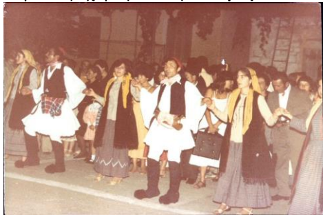
Στην πλατεία της Ράχης

Σε αυτά τα πλαίσια γνωστοί για την λεβεντιά τους Αραχοβίτες/Καρυάτες χόρεψαν το 1937 στο καλλιμάρμαρο Παναθηναϊκό Στάδιο και το 1955 Αραχοβιτοπούλες/Καρυάτιδες ντυμένες «Αμαλίες» χόρεψαν στην Σπάρτη τοπικούς παραδοσιακούς χορούς.